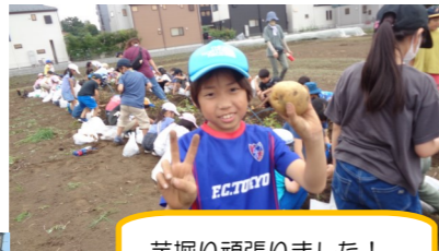
芋掘り頑張りました！