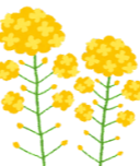
みんなとっても素敵な笑顔です