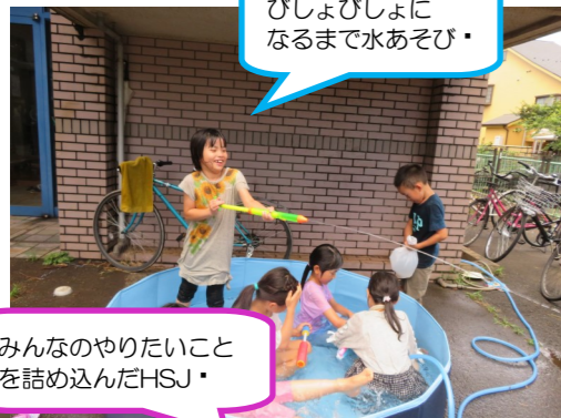
みんなのやりたいことを詰め込んだHSJ